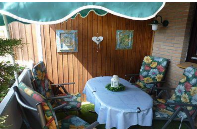
Balkontür mit Insektenschutztür