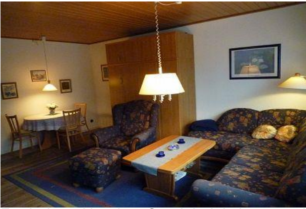
Esstisch ausklappbar, Couchtisch höhenverstellbar