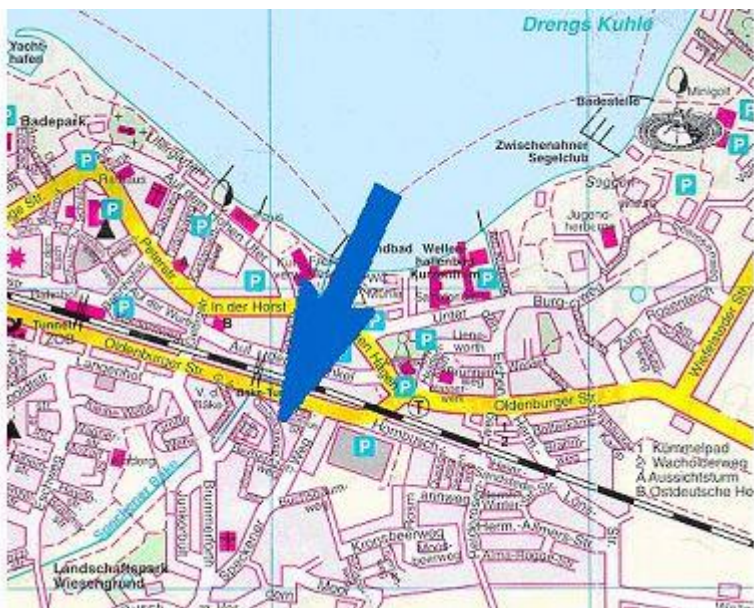
In direkter Nähe: Kurpark, Restaurants, Supermärkte, Bahnhof