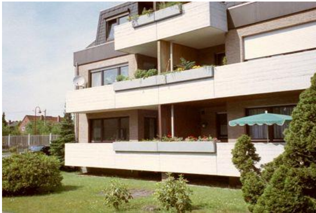
Ruhige Lage mit Balkon zur Südseite