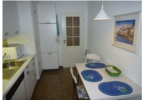
Viele Küchenkleingeräte teils im Schrank