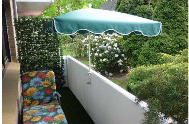
Balkon komplett mit Kunstrasen ausgelegt