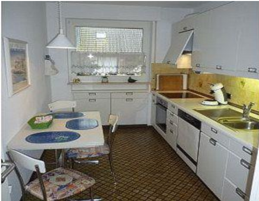
Alle Elektrogeräte erneuert