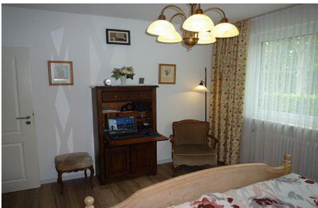
beleuchteter Sekretär / alternativ mit PC oder 2. TV