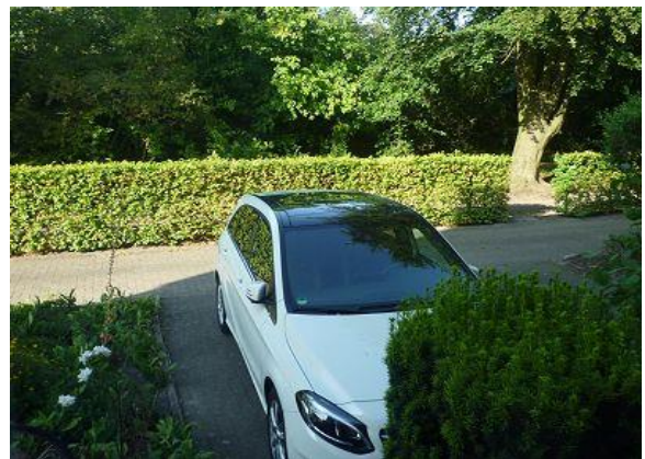
Schlafzimmerfenster mit Insektenschutz (direkt über dem Parkplatz) Blick vom Schlafzimmer zum Radweg