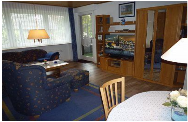
Komplett neue Unterhaltungselektronik