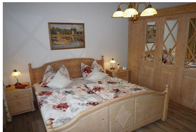
Matratzen mit Härtegraden II und III