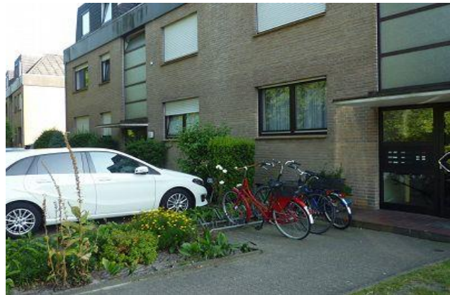
Parkplatz direkt neben dem Hauseingang