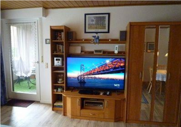
TV wählbar Magenta oder Satellit