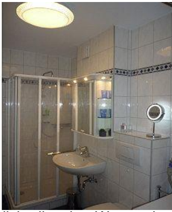
Oberlicht dimmbar Warm oder Kaltlicht