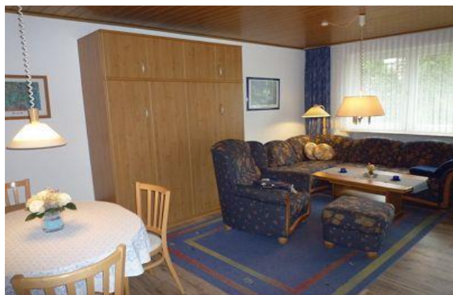
gemütlicher Wohnraum mit Schlafcouch