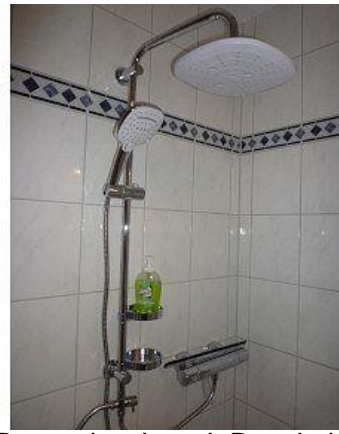
Regendusche mit Duschsitz