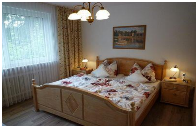
Fenster Nordseite dreifach verglast