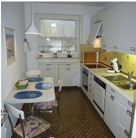
Alle Elektrogeräte erneuert