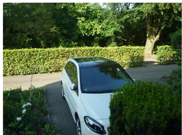
Blick vom Schlafzimmer zum Radweg