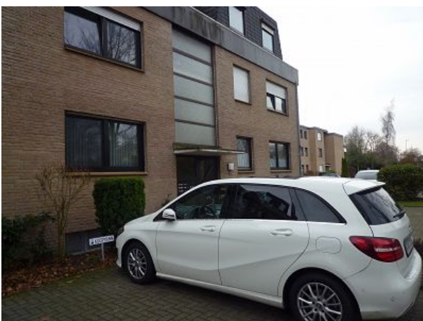
Schlafzimmerfenster mit Insektenschutz