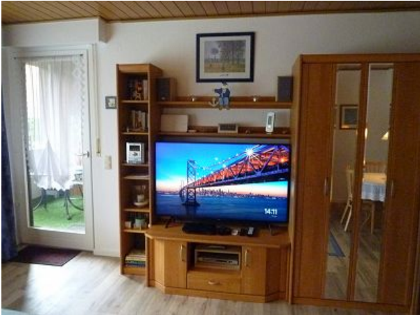
TV wählbar Magenta oder Satellit