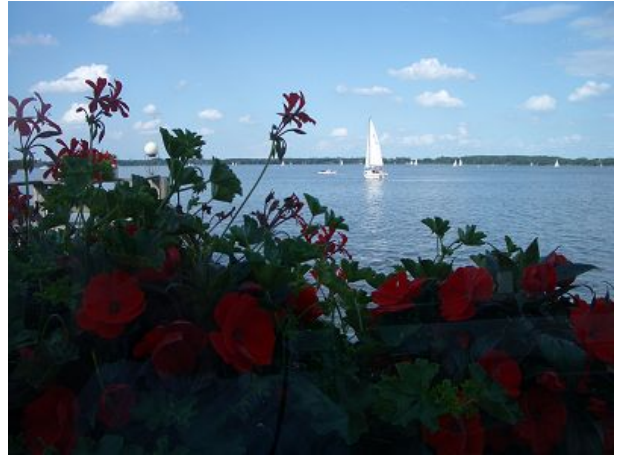
Kurpark nur fünf Fußminuten entfernt