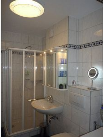
Oberlicht dimmbar Warm oder Kaltlicht