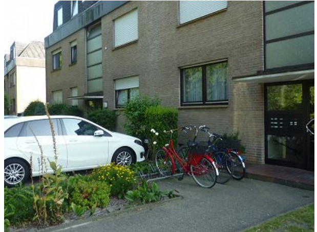
Parkplatz direkt neben dem Hauseingang