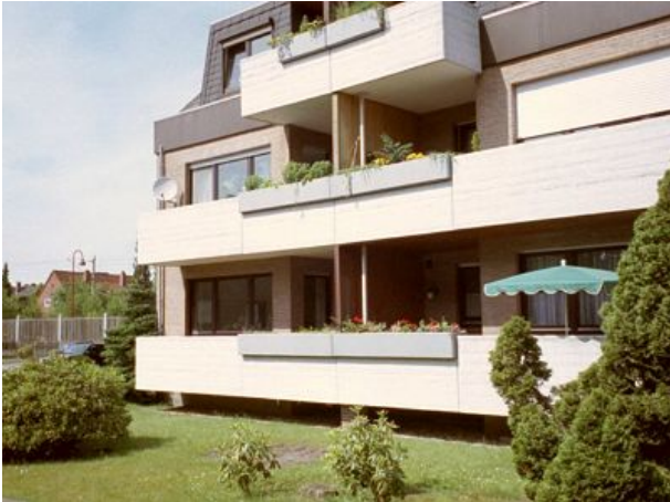
Ruhige Lage mit Balkon zur Südseite