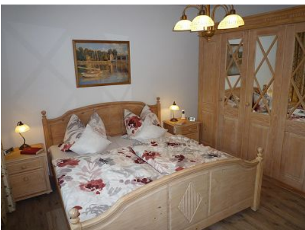
Matratzen mit Härtegraden zwei und drei