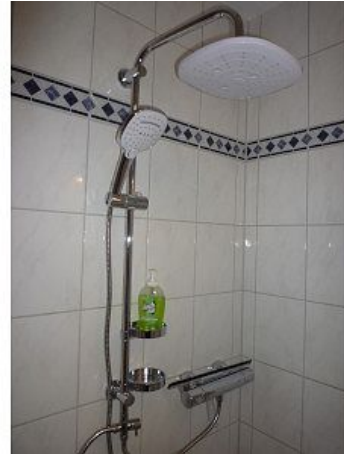
Regendusche mit Duschsitz