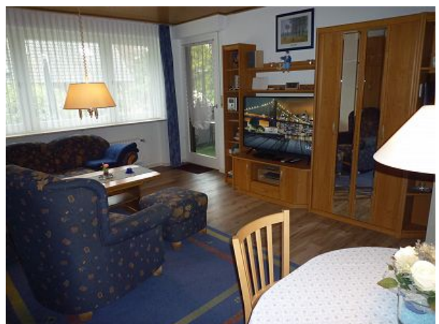
Komplett neue Unterhaltungselektronik