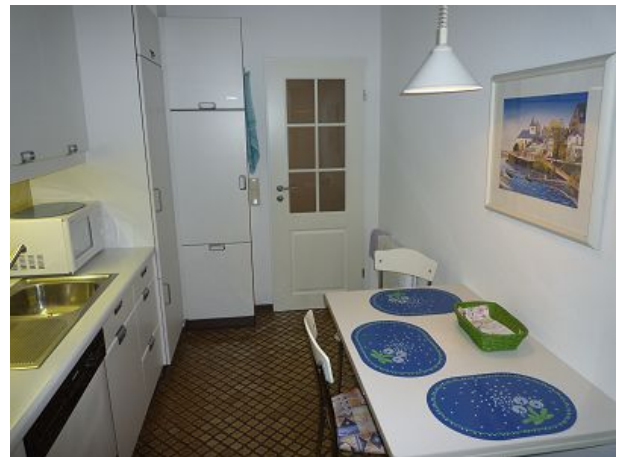
Viele Küchenkleingeräte teils im Schrank