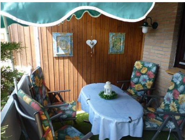
Balkontür mit Insektenschutztür