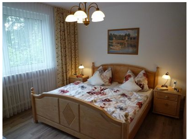
Fenster Nordseite dreifach verglast