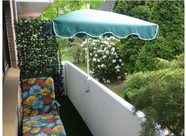
Balkon komplett mit Kunstrasen ausgelegt