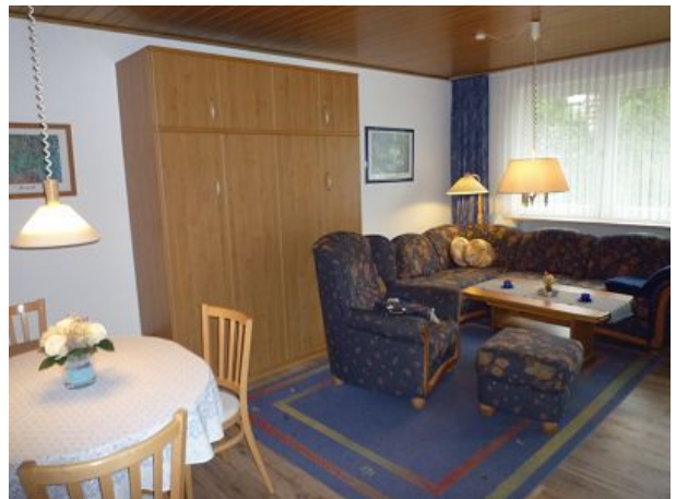
gemütlicher Wohnraum mit Schlafcouch